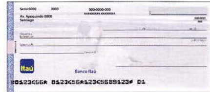
"Homenaje", óleo sobre tela, Carolina Landea

devolución de la comisión Itaú Personal, sea imputado al pago parcial o total de las deudas u obligaciones que tenga con el Banco.