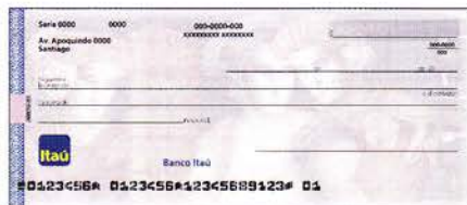
"Virgenes", óleo sobre tela, Carmen Aldunate